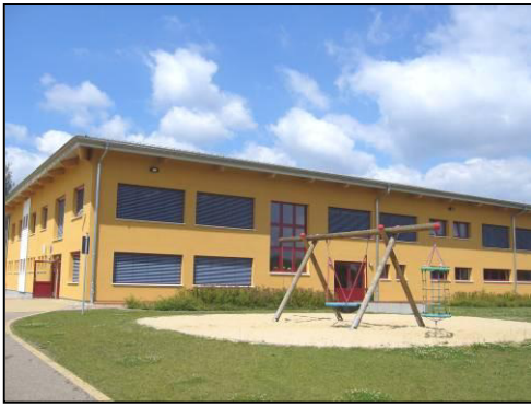
Serbskŕ zakładna ŕula Rałbicy